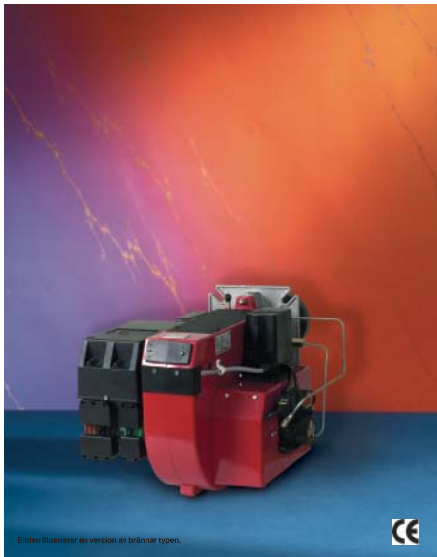
Bilden illustrerar en version av brännar typen.