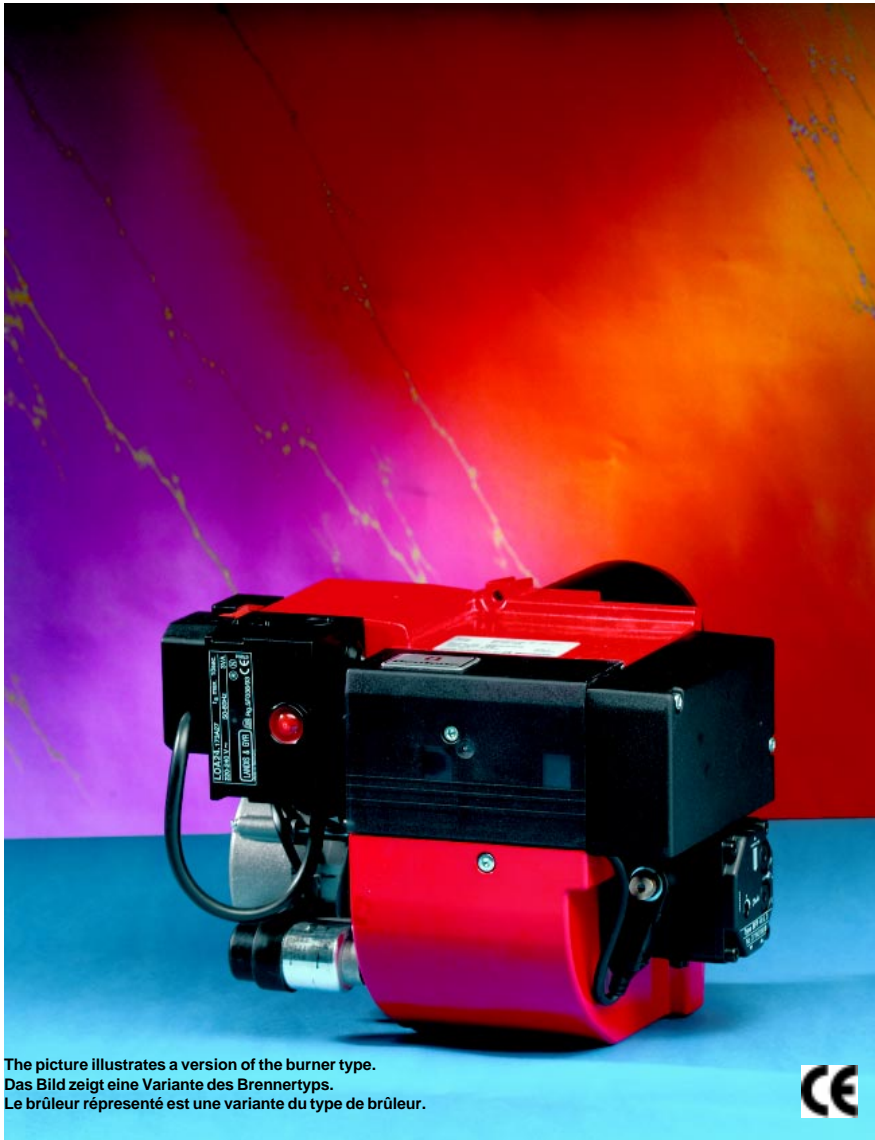
The picture illustrates a version of the burner type. Das Bild zeigt eine Variante des Brennertyps. Le brûleur représenté est une variante du type de brûleur.